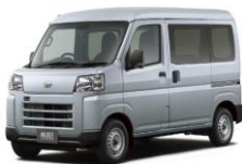
ダイハツ ハイゼットカーゴ