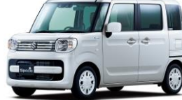
スズキ スペーシア