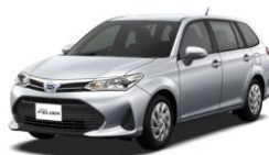
トヨタ カローラフィールダー