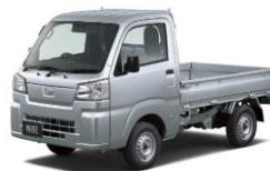
ダイハツ ハイゼットトラック